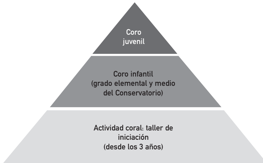
Figura 2. Modelo de coro de niños del Conservatorio.

niños de alguna escuela o algún otro centro. Tras una solicitud de ingreso los alumnos de la propia entidad se incluyen directamente, y solo se hace una prueba a los que vienen de fuera.